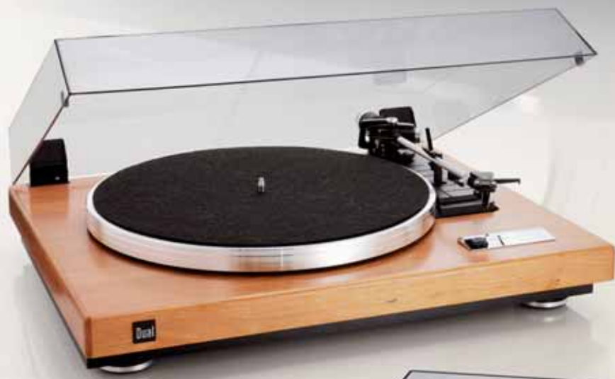
Farbe: Nussbaum Hell