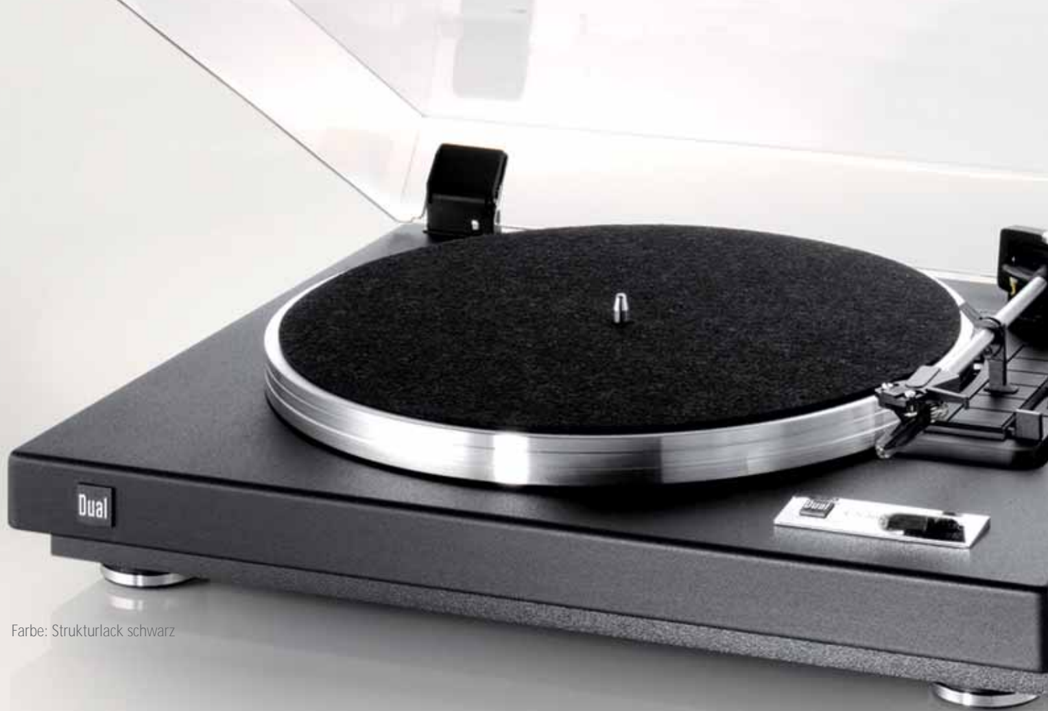
Farbe: Strukturlack schwarz