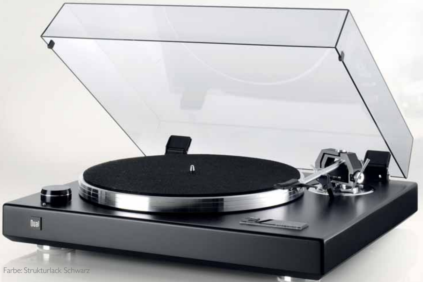
Farbe: Strukturlack Schwarz