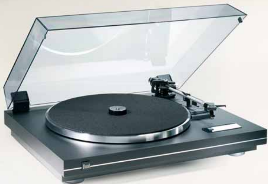
Farbe: Schwarz / Finisch Silber