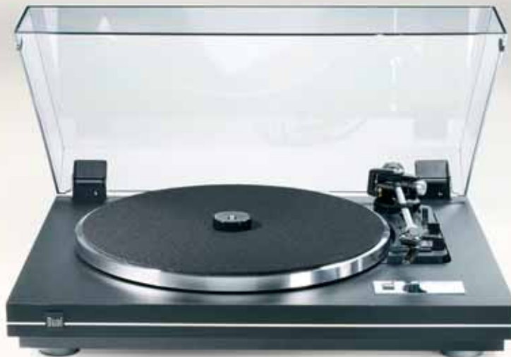
Farbe: Schwarz / Finish Silber