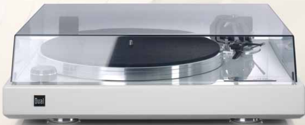
Comming Soon! Farbe: Klavierlack Weiss