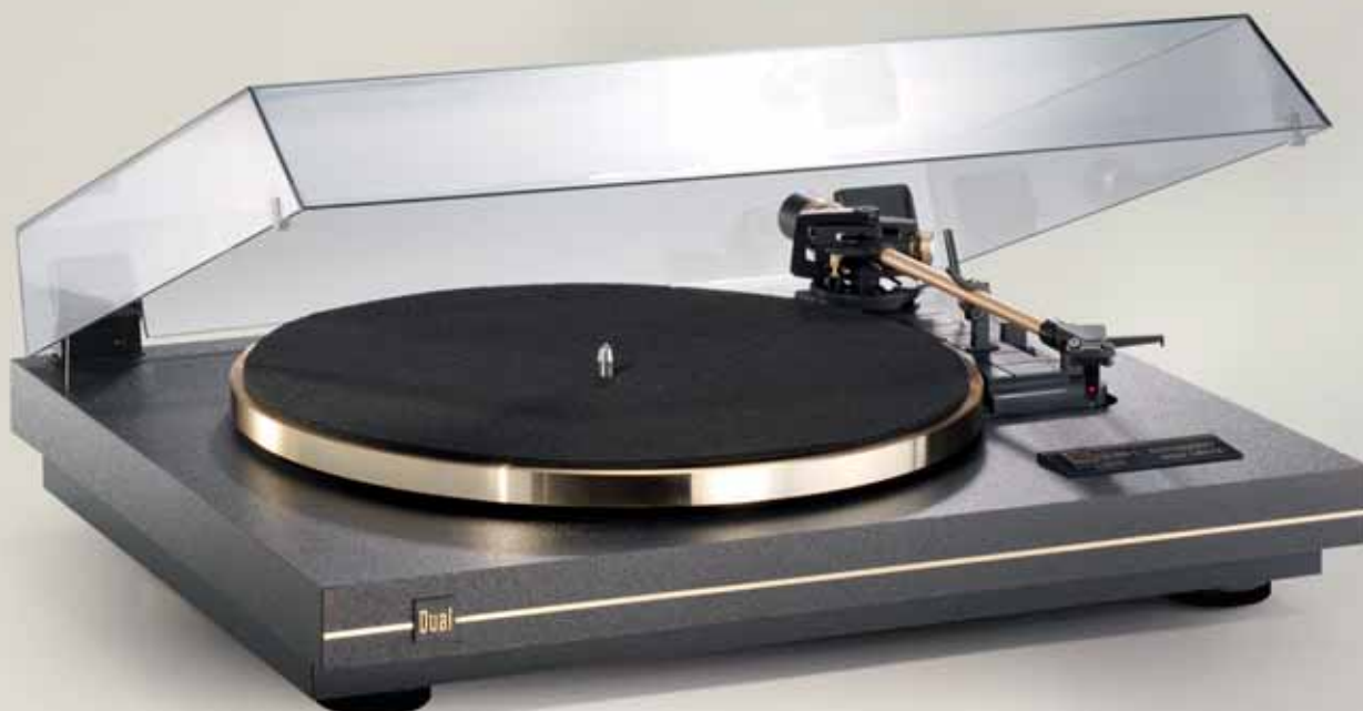
Farbe: Schwarz / Finish Gold