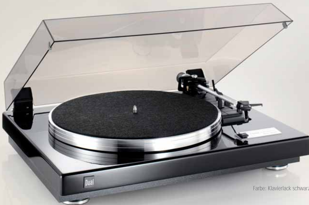
Farbe: Klavierlack schwarz