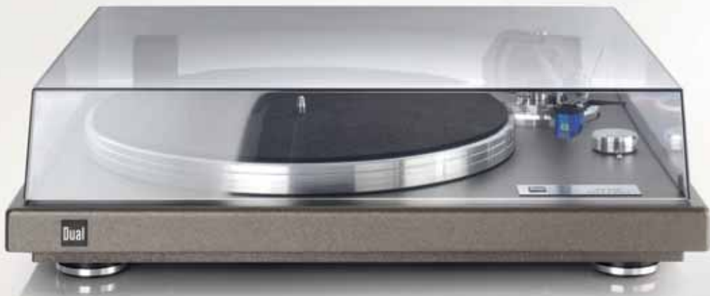
Farbe: Antrazit Metallic