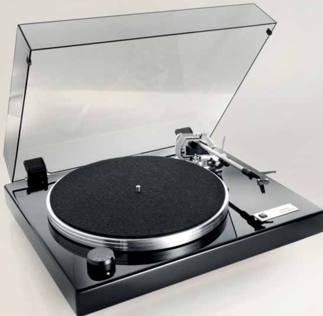
Farbe: Klavierlack Schwarz