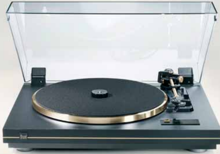
Farbe: Schwarz / Finish Gold

Auch erhältlich mit integriertem Phono-Entzerrervorverstärker